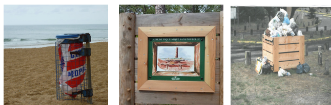
Figures 2 et 3 Pannonceaux et communication ONF

La gestion environnementale des sites et notamment la gestion des déchets constitue l'un des 6 enjeux régionaux identifiés dans le cadre du Schéma Régional des plans plages aquitains. Testée depuis 2012 par l'ONF sur plusieurs sites girondins et landais (Carcans, Lacanau, Le Porge, Lège Cap Ferret, Biscarrosse et Mimizan), la démarche poursuit comme objectif principal de maintenir une forêt propre durablement, au coût le plus bas. La mise en œuvre d'un tel dispositif peut s'appréhender dans le temps, et de manière différenciée selon le niveau de fréquentation des sites.